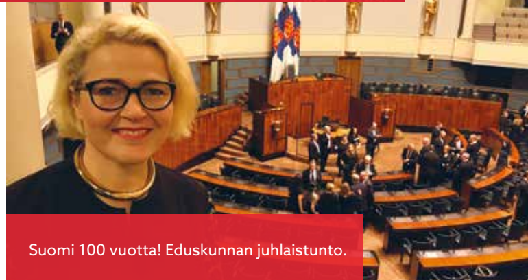
Suomi 100 vuotta! Eduskunnan juhlaistunto.