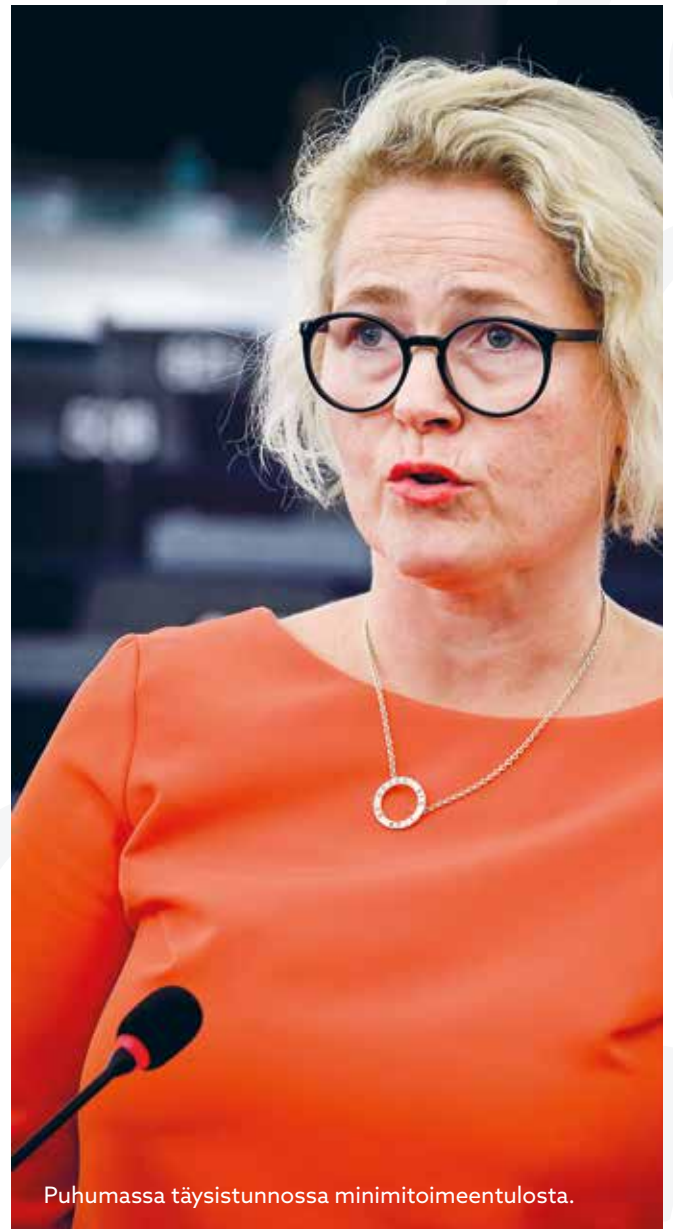
Puhumassa täysistunnossa minimitoimeentulosta.

Emme me voi haluta, että jossain jäsenmaassa työntekijä voi menettää työpaikkansa siksi, että samaan maahan lähetetylle työntekijälle saa maksaa tätä alhaisempaa palkkaa. Myös muiden etuuksien dumpkauksen mahdollisuutta heikennetään eli tasavertaisuutta lisätään.