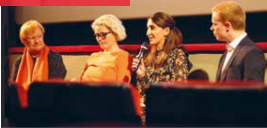
Syysseminaari kestävästä kehityksestä Helsingissä.