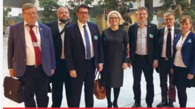
Ammattiliitto Pron, Insinööriliiton ja TEK:n edustajia Brysselissä joulukuussa 2017.