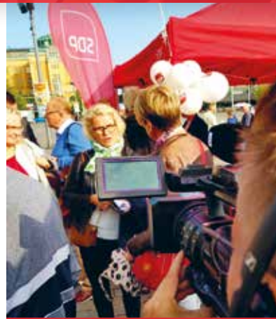
Digimepin arkea Strasbourgissa.