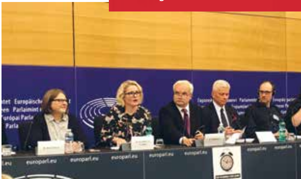
Kesäaika puhuttaa. Pressi aiheesta parlamentissa syksyllä 2017.