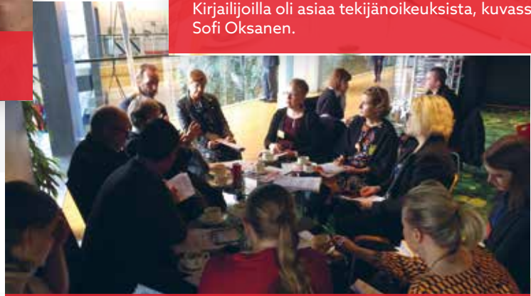
Toimittajien pressikahvit Strasbourgissa.