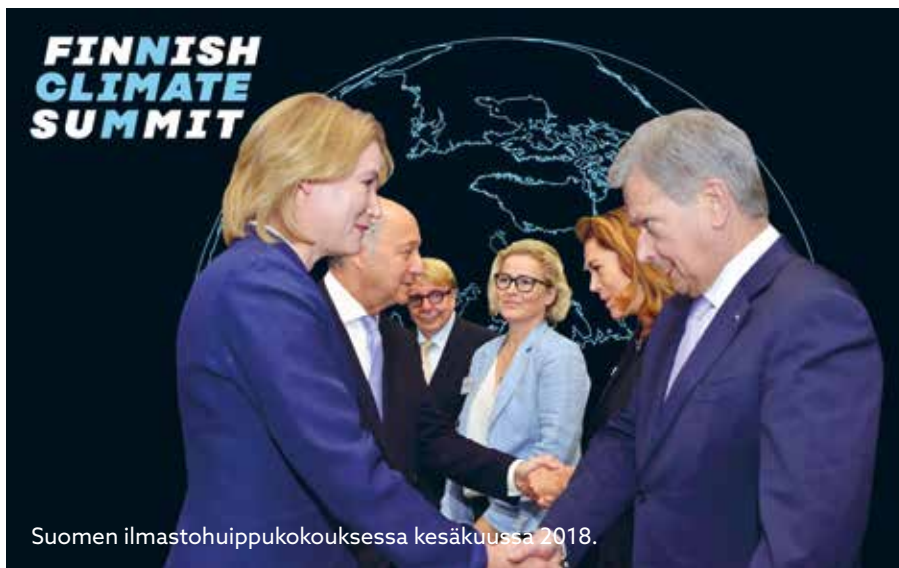
Suomen ilmastohuippukokouksessa kesäkuussa 2018.

Edustin parlamentin demariryhmää neuvotteluissa ja olin tyytyväinen neuvottelutulokseen.