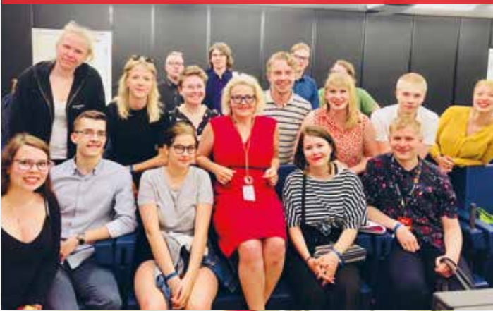
Suomen nuorten delegaatio The European Youth Event -forumissa Strasbourgissa kesäkuussa 2016.