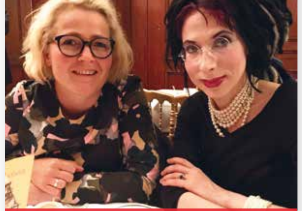
Kirjailijoilla oli asiaa tekijänoikeuksista, kuvassa Sofi Oksanen.