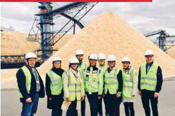
Tiimi tutustumassa Äänekosken uuteen tehtaaseen.