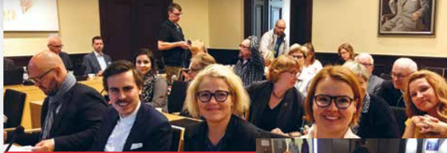
Vaasan valtuusto syyskuussa 17.