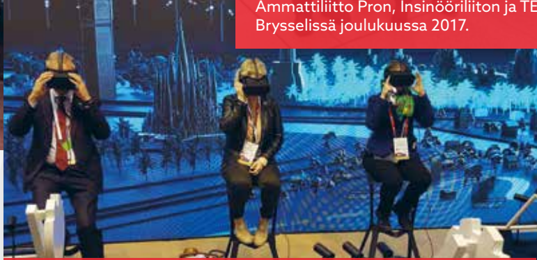
Digimeppi digimessuilla Barcelonassa helmikuussa.