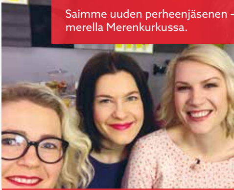
Selfie juuri ennen Aamu-tv:tä! Aiheena kesäaika.