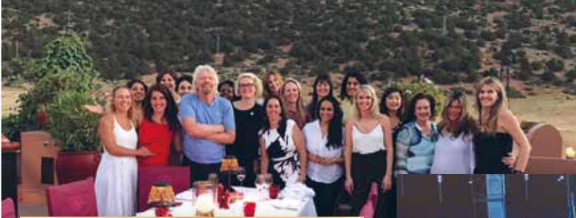
Kansainvälinen digiseminaari lohkoketjusta Richard Bransonin kutsusta.